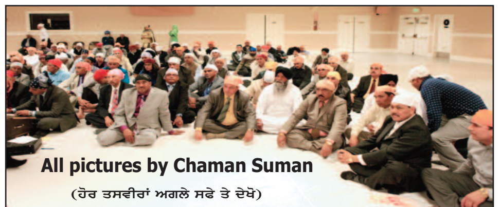
(ਹੋਰ ਤਸਵੀਰਾਂ ਅਗਲੇ ਸਫੇ ਤੇ ਦੇਖੋ)