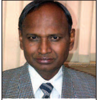
ਡਾ. ਉਦਿਤ ਰਾਜ ਸਿੰਘ ਮੈਂਬਰ (ਲੋਕ ਸਭਾ)

ਭਾਰਤ ਵਿਚ ਕਮਿਊਨਿਸਟ ਪਾਰਟੀ ਦੀ ਸਥਾਪਨਾ 1925 ਵਿਚ ਹੋਈ ਸੀ। 1917 ਵਿਚ ਰੂਸ ਦੀ ਬੋਲਸ਼ੇਵਿਕ ਕ੍ਰਾਂਤੀ ਦਾ ਅਸਰ ਪੂਰੀ ਦੁਨੀਆਂ ਤੇ ਉਦੋਂ ਫੈਲ ਚੁੱਕਾ ਸੀ। ਕਾਰਲ ਮਾਰਕਸ ਨੇ ਵਿਚਾਰਕ ਪਿਠਭੂਮੀ ਤਿਆਰ ਕੀਤੀ ਸੀ। ਲੈਨਿਨ, ਸਟਾਲਿਨ, ਟ੍ਰਾਇਸਕੀ ਆਦਿ ਨੇ ਉਸਨੂੰ ਅਮਲੀ ਜਾਮਾ ਪੁਆਇਆ। ਉਥੋਂ ਦੀਆਂ ਪ੍ਰਸਥਿਤੀਆਂ ਦੇ ਹਿਸਾਬ ਨਾਲ ਉਹਨਾਂ ਨੇ ਸਮਾਜ ਦਾ ਵਿਸ਼ਲੇਸ਼ਣ ਕੀਤਾ ਅਤੇ ਮਾਰਕਸ ਦੇ ਵਿਚਾਰ ਨੂੰ ਲਾਗੂ ਕੀਤਾ। ਸਮਵਾਦੀ ਵਿਚਾਰਧਾਰਾ ਦੀ ਮਾਨਤਾ ਹੈ ਕਿ ਦੁਨੀਆਂ ਦੇ ਭਾਗਾਂ ਵਿਚ ਵੰਡੀ ਹੈ। ਇਕ ਗਰੀਬ ਅਤੇ ਦੂਜਾ ਅਮੀਰ। ਇਸਨੂੰ ਲੁਟੇਰਾ ਅਤੇ ਕਮੇਰਾ ਜਾਂ ਸ਼ੋਕ ਅਤੇ ਸ਼ੋਸ਼ਿਤ ਦੇ ਰੂਪ ਵਿਚ ਅਸੀਂ ਜਾਣਦੇ ਹਾਂ। ਭਾਰਤ ਦੇ ਸਮਾਜ ਦੀ ਸਰੰਚਨਾ ਹੋਰ ਸਮਾਜ ਤੋਂ ਵੱਖਰੀ ਹੈ ਪਰ ਭਾਰਤ ਦੀ ਕਮਿਊਨਿਸਟ ਪਾਰਟੀ ਦੇ ਸੰਸਥਾਪਕਾਂ ਨੇ ਉਸੇ ਚਸ਼ਮੇ ਨਾਲ ਦੇਖਿਆ ਜੋ ਦੂਜੇ ਦੇਸ਼ ਦੇ ਕਮਿਊਨਿਸਟਾਂ ਨੇ ਕੀਤਾ। ਕੁਝ ਕਹਿਣਾ ਮੁਸ਼ਕਿਲ ਹੈ ਕਿ ਇੱਥੋਂ ਦੇ ਕਮਿਊਨਿਸਟਾਂ ਨੇ ਇਹ ਇਤਿਹਾਸਕ ਗਲਤੀ ਕਰਕੇ ਦੇਸ਼ ਦਾ ਹਿੱਤ ਕੀਤਾ ਜਾਂ ਅਹਿਤ। ਹੁਣ ਤੱਕ ਚੱਲ ਰਹੇ ਦਲਿਤ ਅੰਦੋਲਨ ਨੂੰ ਜਾਤੀ ਅੰਦੋਲਨ ਹੀ ਉਹ ਮੰਨਦੇ ਰਹੇ ਪਰ ਹੌਲੀ-ਹੌਲੀ ਇਕ ਦਹਾਕੇ ਵਿਚ ਤਬਦੀਲੀ ਆਉਣ ਲੱਗੀ। ਇਹ ਤਬਦੀਲੀ ਅਸਫਲਤਾ ਤੋਂ ਤਾਂ ਘੱਟ ਮਜ਼ਬੂਰੀ ਵੱਸ ਜ਼ਿਆਦਾ ਆਉਣ ਲੱਗੀ। ਇਹਨਾਂ ਦਾ ਬੌਧਿਕ ਚਿੰਤਨ ਕਿੰਨਾ ਕਮਜ਼ੋਰ ਹੈ ਕਿ ਇਹ ਅਸਫਲਤਾ ਤੋਂ ਵੀ ਨਹੀਂ ਸਿੱਖੇ। ਮਜ਼ਬੂਰੀ ਵੱਸ ਤਾਂ ਕੋਈ ਵੀ ਕਰਦਾ ਹੈ, ਜੋ ਅੱਜ ਇਹ ਕਰ ਰਹੇ ਹਨ। ਕਨੁਈਆ ਕੁਮਾਰ ਨੇ ਜੇਲ੍ਹ ਤੋਂ ਵਾਪਸ ਆ ਕੇ ਜਦੋਂ ਜੇ. ਐਨ. ਯੂ. ਵਿਚ ਭਾਸ਼ਣ ਦਿੱਤਾ ਤਾਂ ‘ਲਾਲ ਸਲਾਮ’ ਦਾ ਨਾਅਰਾ ਹੀ ਨਹੀਂ ਬਲਕਿ ‘ਜੈ ਭੀਮ’ ਦਾ ਵੀ ਲਗਾਇਆ। ਉਹ ਸਭ ਨਾਅਰੇ ਲੱਗੇ ਜੋ ਕੁਝ ਦਲਿਤ ਲਗਾਉਂਦੇ ਹਨ, ਜਿਵੇਂ ‘ਮਨੁਵਾਦ-ਮੁਰਦਾਬਾਦ, ਬ੍ਰਾਹਮਣਵਾਦ-ਮੁਰਦਾਬਾਦ’ ਆਦਿ। ਕੁਝ ਪਲ ਦੇ ਲਈ ਤਾਂ ਭਰਮ ਪੈਦਾ ਹੋ ਗਿਆ ਕਿ ਇਹ ਸਭਾ ਖੱਬੇ ਪੱਖੀਆਂ ਦੀ ਹੈ ਜਾਂ ਅੰਬੇਡਕਰਵਾਦੀਆਂ ਦੀ।