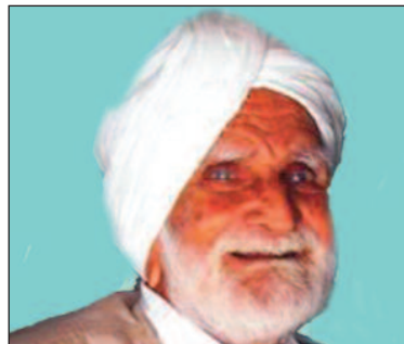
ਗਦਰੀ ਬਾਬਾ ਭਗਤ ਸਿੰਘ ਬਿਲਗਾ ਜੀ ਦੇ 109ਵੇਂ ਜਨਮ ਦਿਹਾੜੇ ਨੂੰ ਸਮਰਪਿਤ ਵਿਸ਼ੇਸ਼ ਲੇਖ ਅੰਦਰ ਦੇਖੋ